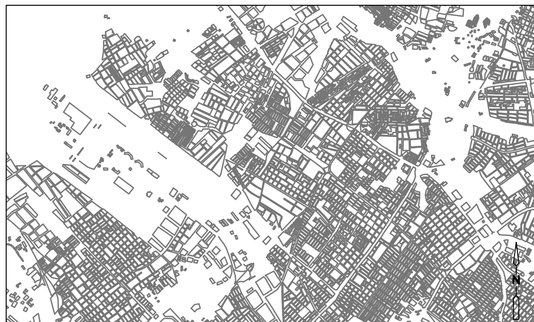
PLANO GENERAL DE LOCALIZACIÓN