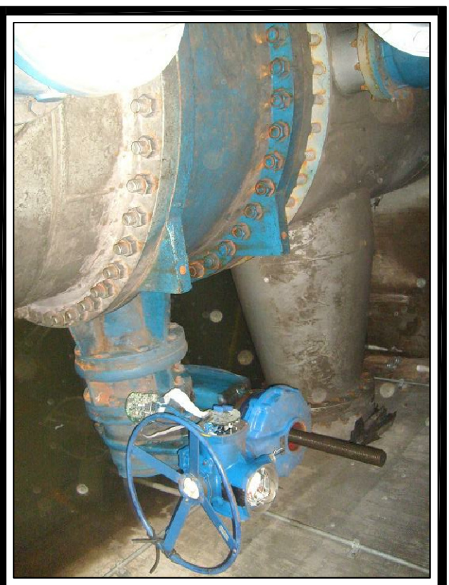
FOTO No. 2 Vista de la Valvula V-39