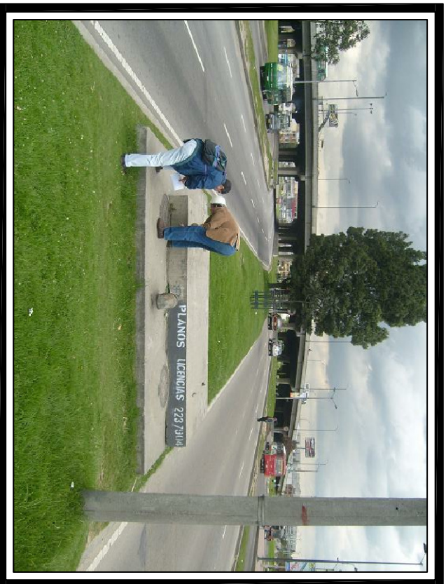
FOTO No. 1 Vista Externa de la Camara