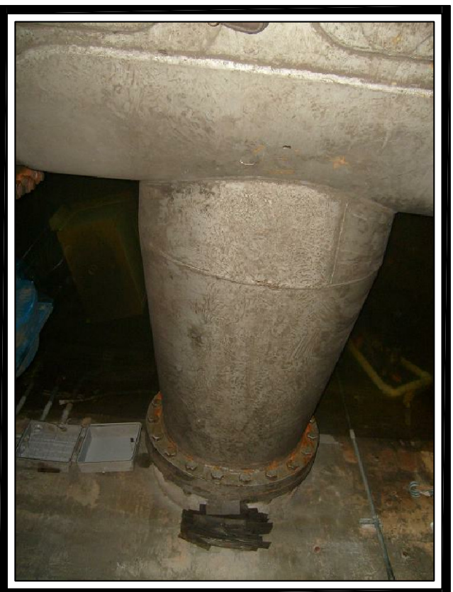
FOTO No. 4 Vista de la Salida Lateral con Reduccion