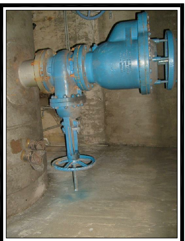
FOTO No. 5 Vista de la Ventosa Accesorio 177B