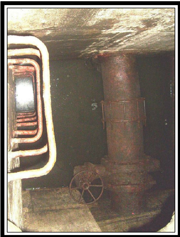
FOTO No. 2 Vista Interna de la Camara