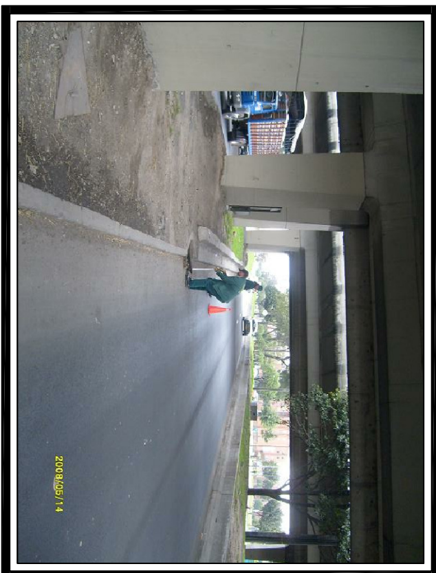
FOTO No. 1 Vista Externa de la Cámara