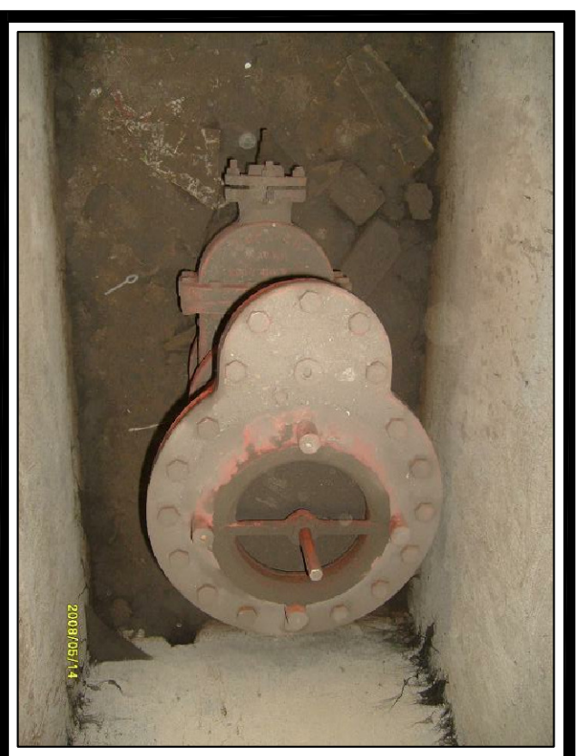
FOTO No. 2 Vista Interna de la Cámara