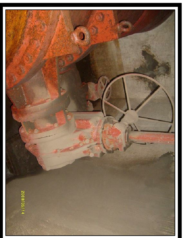
FOTO No. 2 Vista Interna de la Cámara