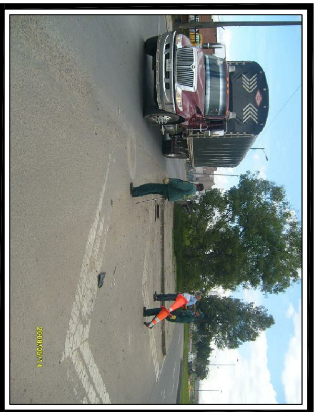
FOTO No. 1 Vista Externa de la Cámara