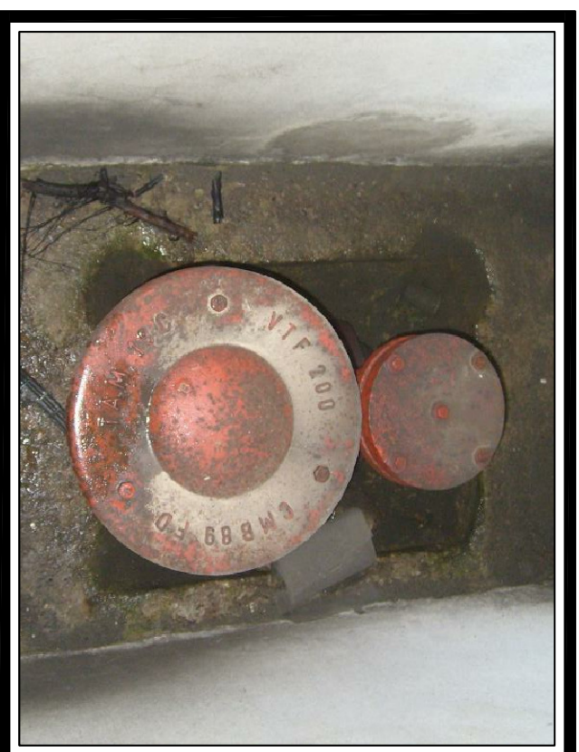
FOTO No. 2 Vista Interna de la Cámara