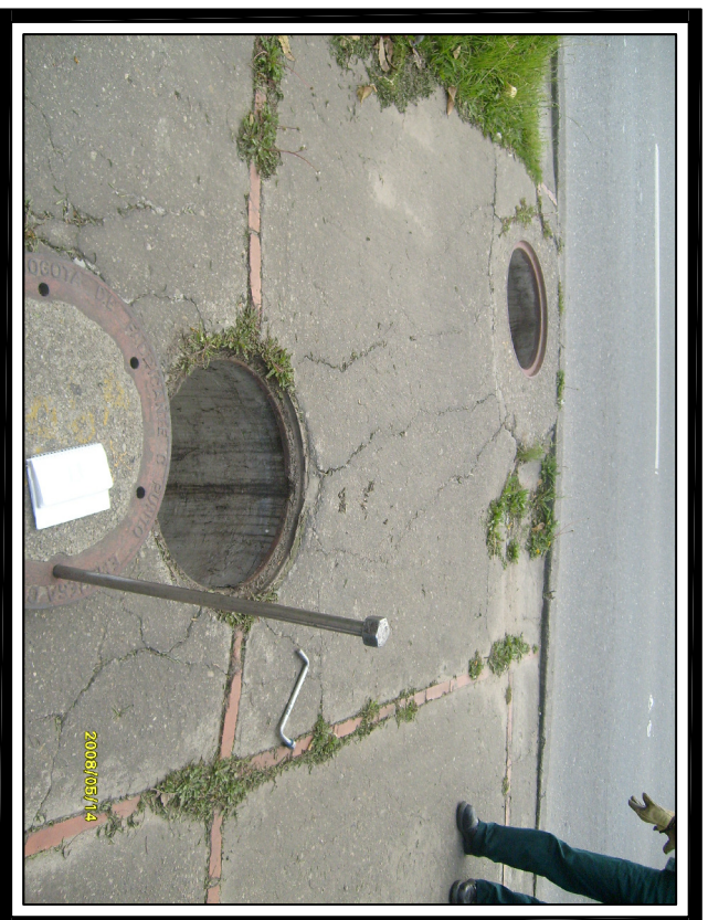
FOTO No. 1 Vista Externa de la Cámara