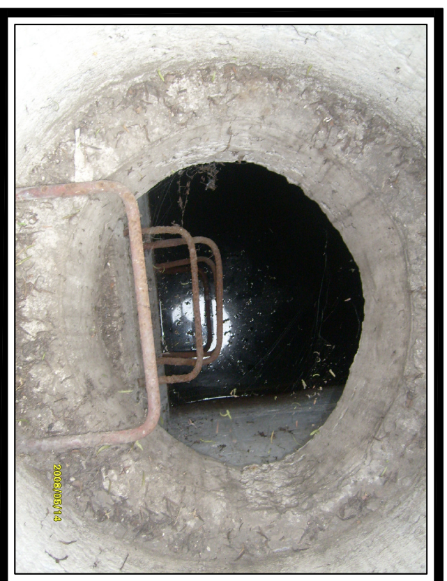
FOTO No. 2 Vista Interna de la Camara