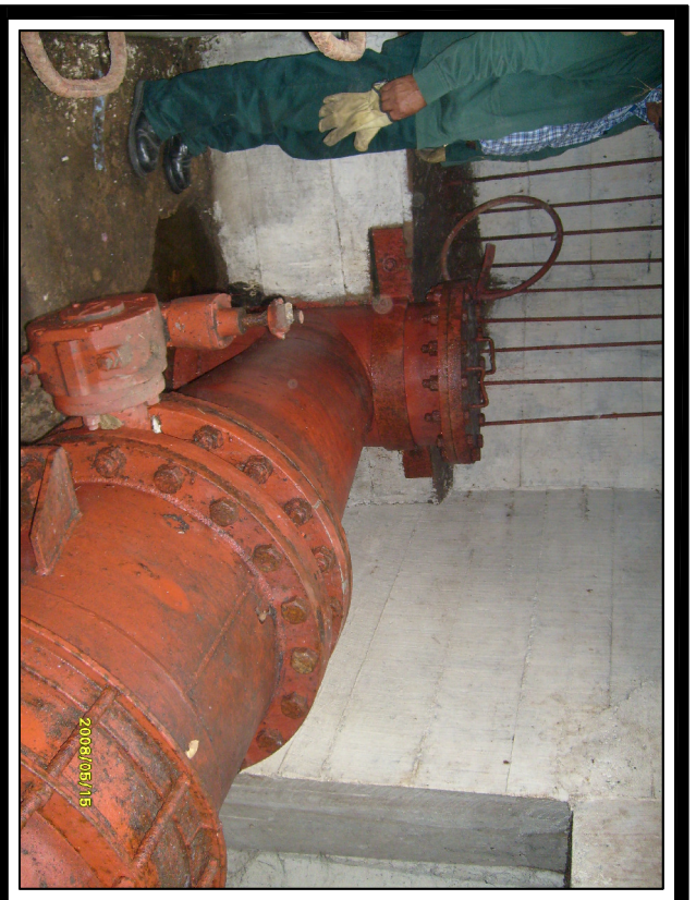
FOTO No. 2 Vista Interna de la Cámara