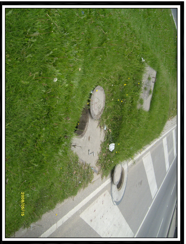
FOTO No. 1 Vista Externa de la Cámara