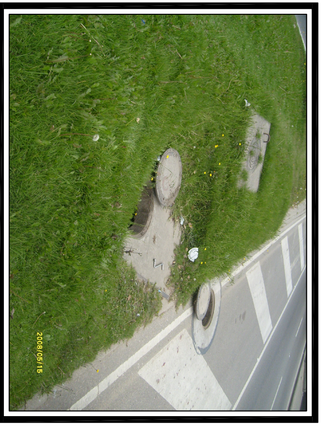
FOTO No. 1 Vista Externa de la Cámara