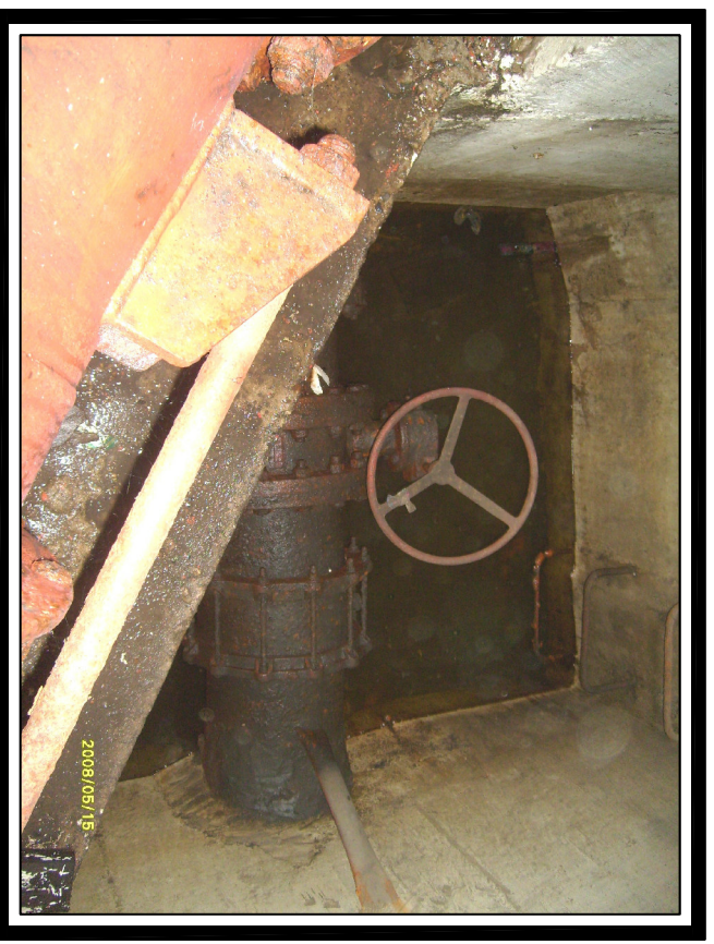
FOTO No. 2 Vista Interna de la Camara