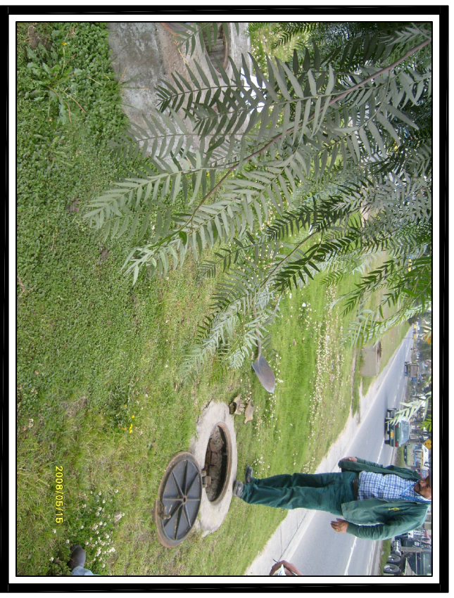
FOTO No. 1 Vista Externa de la Cámara