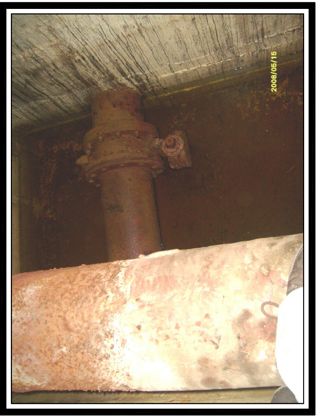
FOTO No. 2 Vista Interna de la Camara