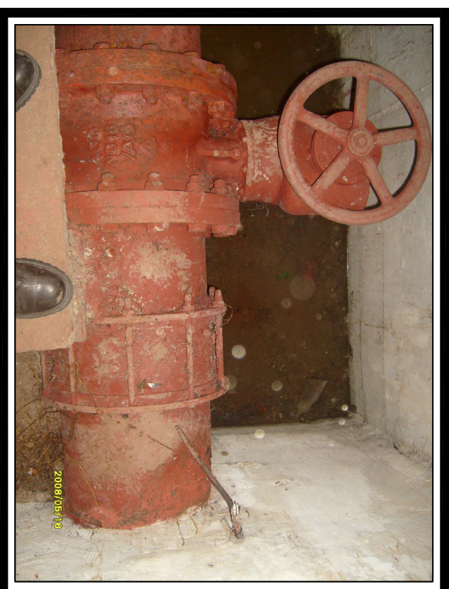
FOTO No. 5 Vista Interna de la Cámara

En trabajos de rehabilitación se recomienda modificar la distribución (especialmente en la purga), para que las uniones dresser \varnothing 16'' , quedan más separados del muro, para facilidad en la operación y desmonte.