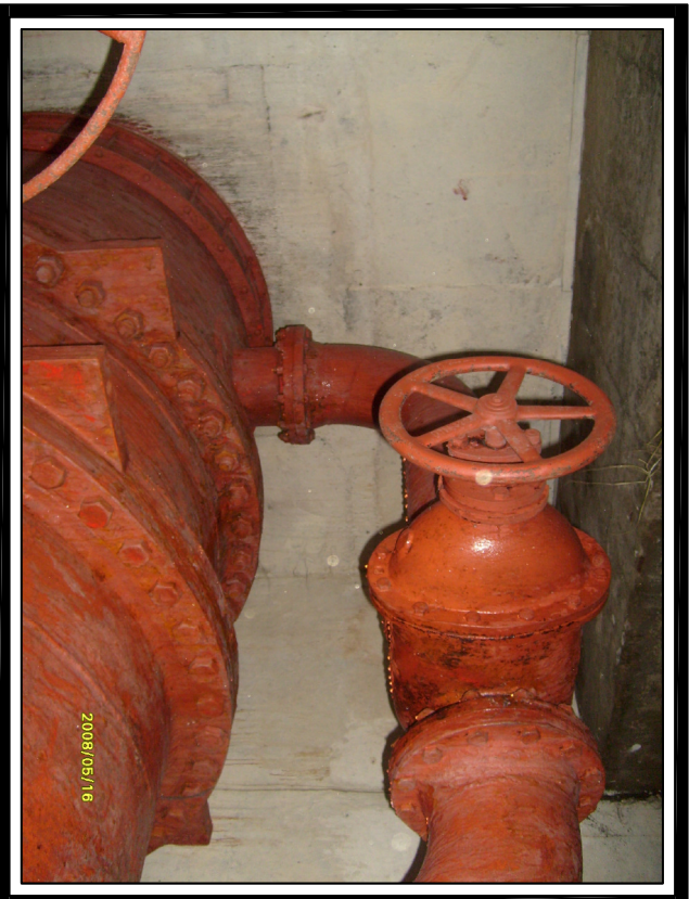
FOTO No. 3 Vista Interna de la Cámara