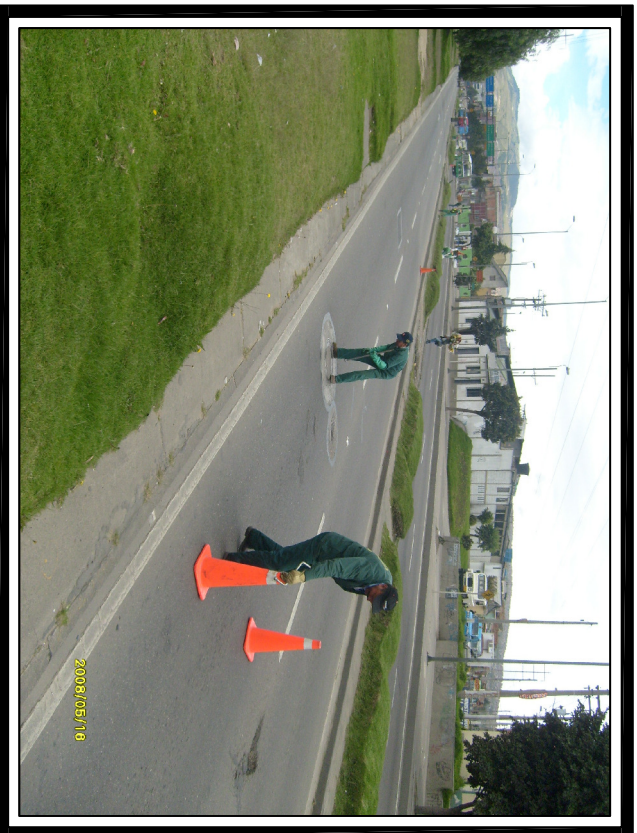
FOTO No. 1 Vista Externa de la Cámara