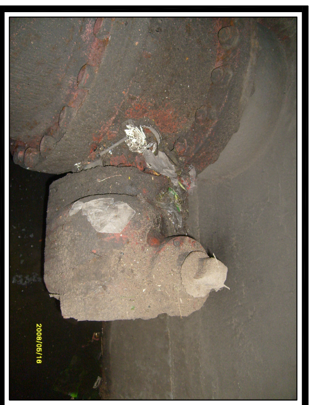
FOTO No. 2 Vista Interna de la Camara