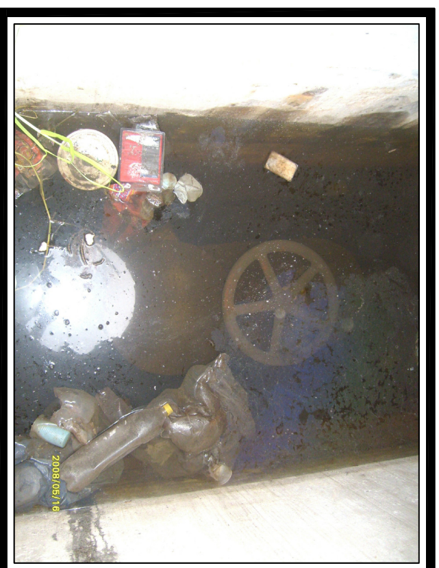
FOTO No. 2 Vista Interna de la Camara