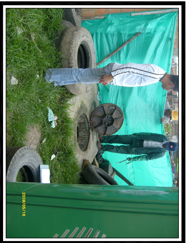
FOTO No. 1 Vista Externa de la Cámara