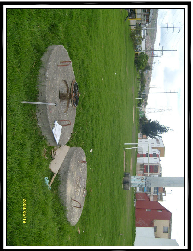
FOTO No. 1 Vista Externa de la Cámara