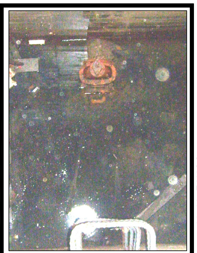
FOTO No. 2 Vista Interna de la Cámara