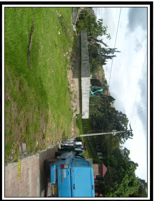
FOTO No. 1 Vista Externa de la Cámara