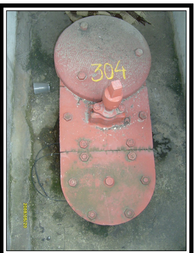
FOTO No. 2 Vista Interna de la Cámara