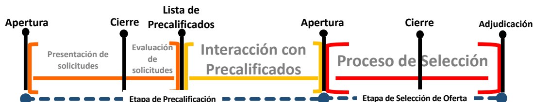
Ilustración 2 – Estructura de la Invitación Pública