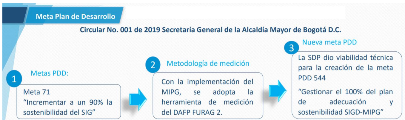
Gráfica No. 1

En consecuencia, para brindar servicios con integridad y calidad, que atiendan los planes de desarrollo, resuelvan las necesidades de los grupos de interés y generen valor público, se estableció la meta de resultado como se ilustra a continuación: