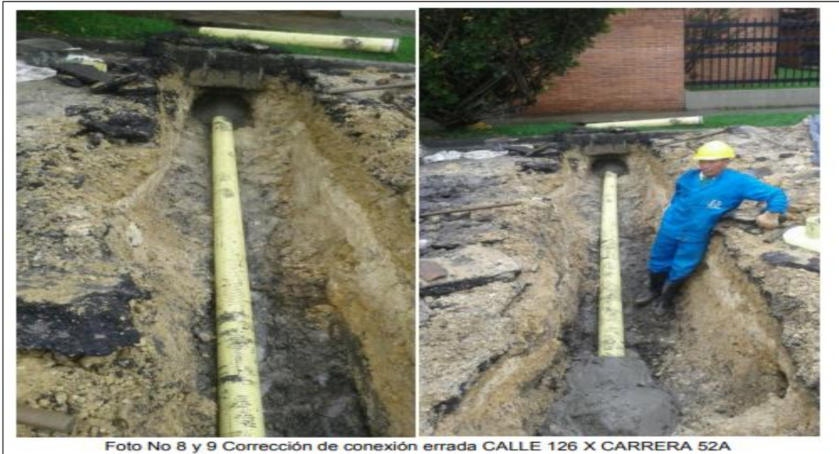
Foto No 8 y 9 Corrección de conexión errada CALLE 126 X CARRERA 52A

"Cada peso cuenta en el bienestar de los bogotanos"