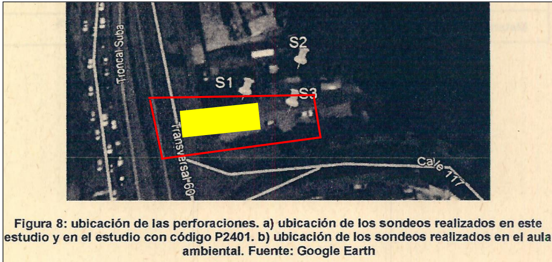
Figura 8: ubicación de las perforaciones. a) ubicación de los sondeos realizados en este estudio y en el estudio con código P2401. b) ubicación de los sondeos realizados en el aula ambiental.

de las obras, que además son parte de los requerimientos de las empresas de servicios públicos.