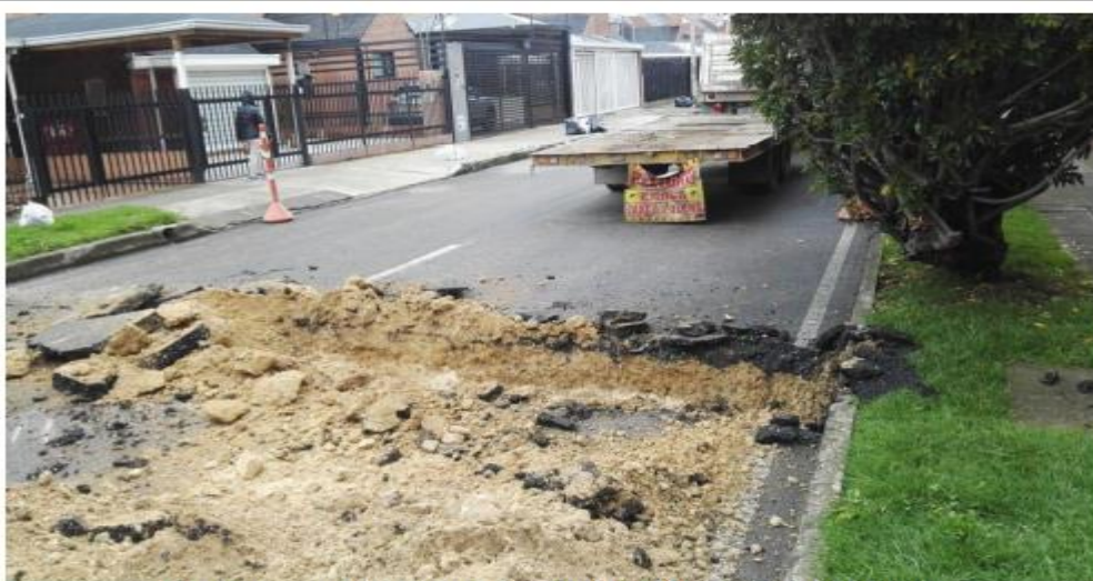
Foto No 7 Corrección de conexión errada CALLE 126 X CARRERA 52A

Ilustración 3. Foto No. 6 Corrección de Conexión errada Calle 126 por Carrera 52ª Fuente: EAAB-ESP