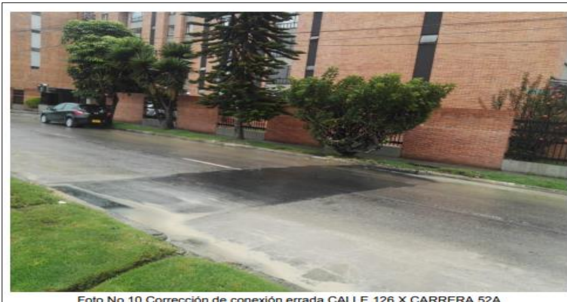
Foto No 10 Corrección de conexión errada CALLE 126 X CARRERA 52A

Ilustración 5-Foto No. 8 y 9 Corrección de conexión errada Calle 126 por carrera 52A