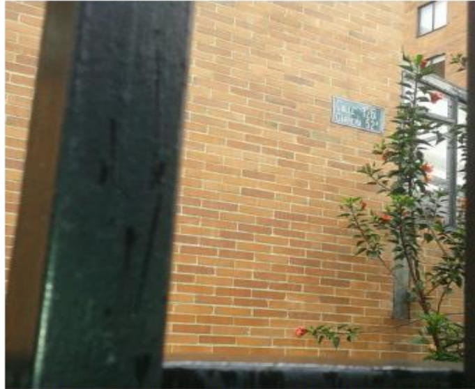
Foto No 6 Corrección de conexión errada CALLE 126 X CARRERA 52A

Ilustración 3. Foto No. 6 Corrección de Conexión errada Calle 126 por Carrera 52ª