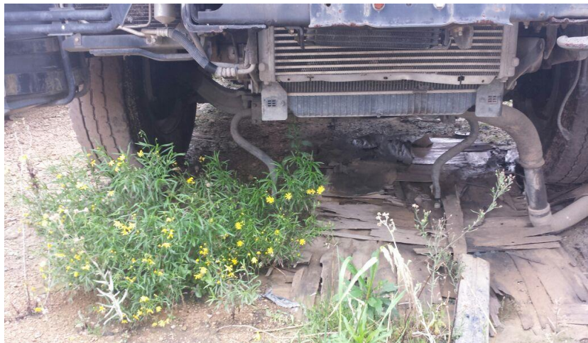
Fotografía: Vehículos para la operación del servicio de aseo de Bogotá D.C. abandonados, deteriorados y deshuesados