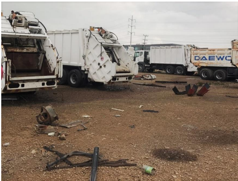
Fotografía: Vehículos para la operación del servicio de aseo de Bogotá D.C. abandonados, deteriorados y deshuesados

En vista de las constantes quejas registradas a través de los medios de comunicación sobre la falla en la Recolección Barrido y Limpieza, la Contraloría de Bogotá dentro del marco de la Auditoría de Regularidad decidió revisar el Estado de la Flota de Vehículos para la operación de aseo de Bogotá D.C., encontrando deficiencias en los mantenimientos preventivos y correctivos contratados por la EAB-ESP. Como se puede observar en el siguiente registro fotográfico: