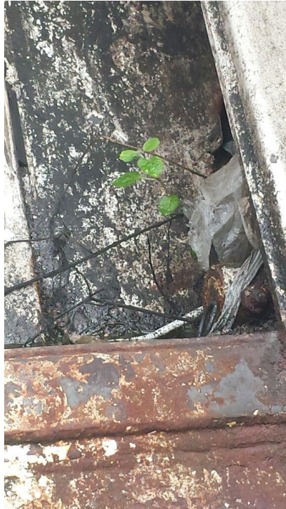
Fotografía: Vehículos para la operación del servicio de aseo de Bogotá D.C. abandonados, deteriorados y deshuesados