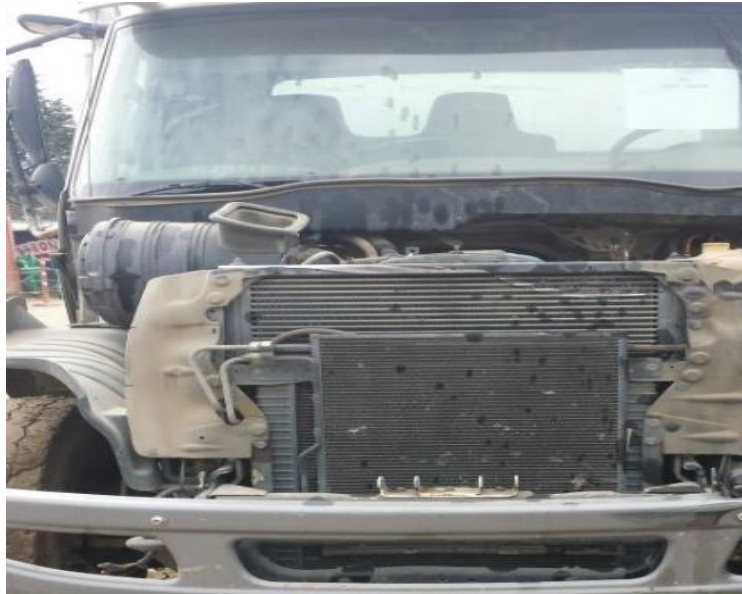
Fotografía: Vehículos para la operación del servicio de aseo de Bogotá D.C. abandonados, deteriorados y deshuesados