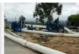
Bombeo de respaldo Estación Fontibón – Capacidad 2x0.5 m3/sg