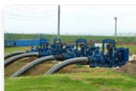
Bombeo de respaldo Estación Gibraltar – Capacidad 4x0.5 m3/sg