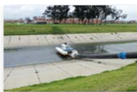
Bombeo de respaldo Canal Cundinamarca – Capacidad 1.2 m3/sg