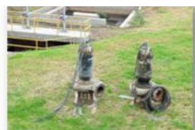
Bombeo de respaldo Estación Gibraltar – Capacidad 2x0.5 m3/sg